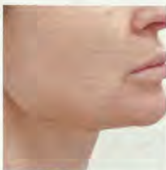
▲ Po zabiegu

Aptos gwarantuje poprawę owalu twarzy i działa rewitalizująco. Wspaniałe efekty, zbliżone do chirurgicznego liftingu twarzy, osiągane są w trakcie minimalnie inwazyjnego zabiegu w gabinecie medycyny estetycznej. Same atuty z punktu widzenia współczesnej, aktywnej kobiety. Ze względu na wyjątkową naturalność efektu zabieg ten często wybierany jest także przez mężczyzn. ■