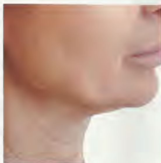
▲ Przed zabiegiem

Za pomocą specjalnej nici lifingującej (wprowadzonej przez pojedyncze nakłucia) można przeprowadzić skuteczny lifting skóry na obszarach takich jak: podbródek, szyja, policzki, ramiona, uda, brzuch i biust.