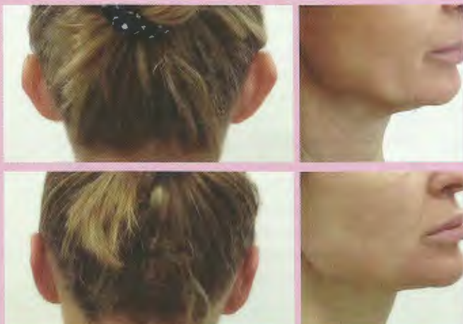
Skóra na szyi i podbródku

ul. Sokola 25, Lubliniec tel. z w4 361 369, 33 856 85 59 www.veno-med.pl