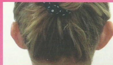
Korekta małżowin usznych/Veno-Med

Pytaj o nową nieinwazyjną linię APTOS Soft.