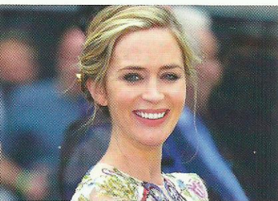
EMILY BLUNT Tajemnice gwiazdy filmu Dziewczyna z pociągu