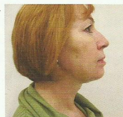
Dwa miesiące po zabiegu