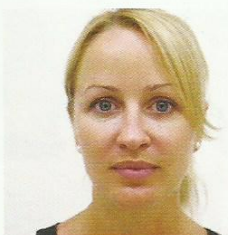
Po miesiącu od zabiegu