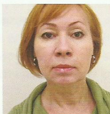
Dwa miesiące po zabiegu