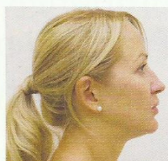
Po miesiącu od zabiegu