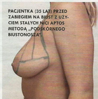
PACJENTKA (35 LAT) PRZED ZABIEGIEM NA BIUST Z UŻYCIEM STAŁYCH NICI APTOS METODĄ „PODSKÓRNEGO BIUSTONOSZA”.