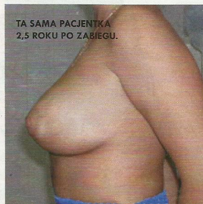
TA SAMA PACJENTKA 2,5 ROKU PO ZABIEGU.